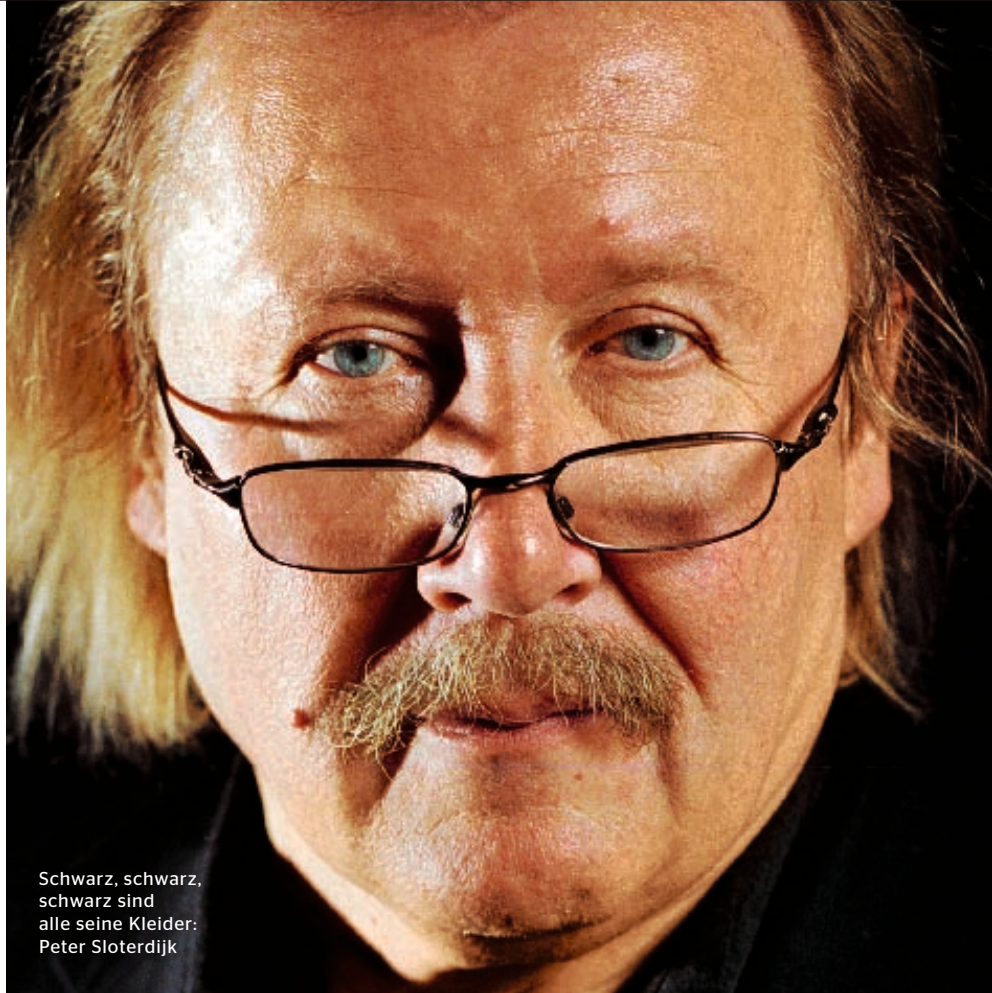
Schwarz, schwarz, schwarz sind alle seine Kleider: Peter Sloterdijk

Sloterdijk: Ich erinnere mich nur an einen